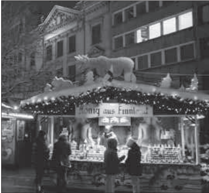
Fast fünf Wochen lang stehen die nostalgischen Hütten Dach an Dach. Hier werden unterschiedliches Kunsthandwerk und feine Köstlichkeiten angeboten.

Ein Bummel über die weltberühmte Königsallee ist gerade ▶ zur Weihnachtszeit ein besonderes Erlebnis. Die großen Kastanienbäume rechts und links der Prachtstraße strahlen mittels Tausender Glühlampen besonders hell.